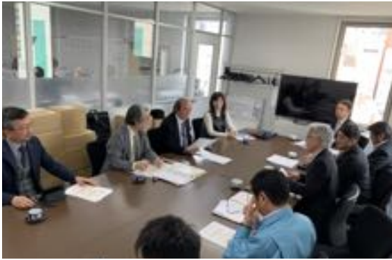
福岡県建築士会との懇談 2019/3/20