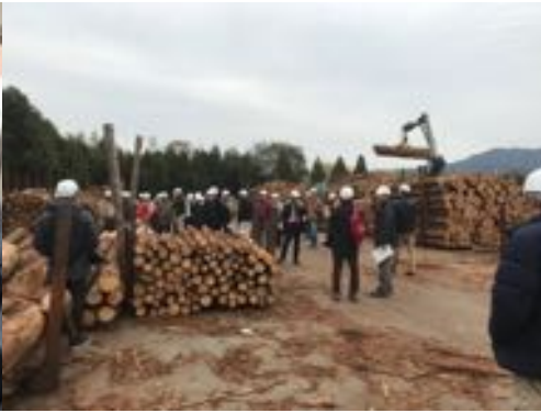
設計者向けバスツアーの様子 2017/11/25